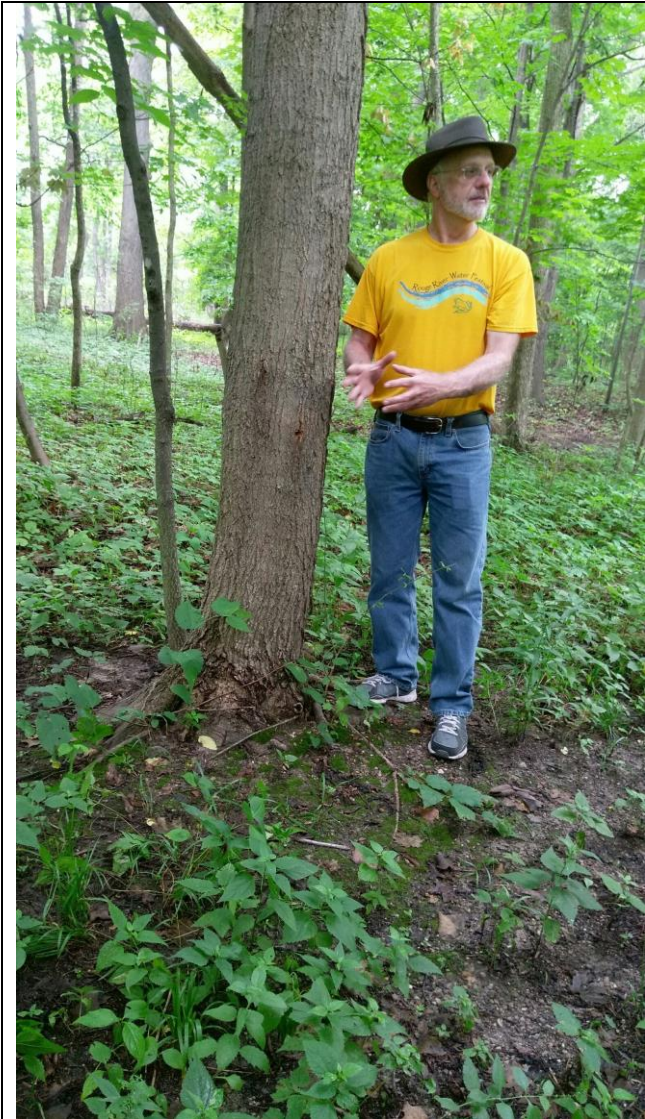
介紹歷史及分辨植物