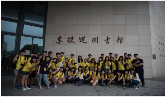
參觀李政道圖書館