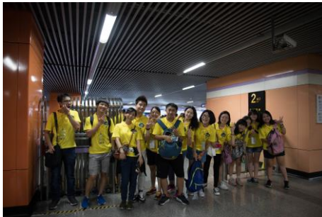
第一次搭上海的地鐵